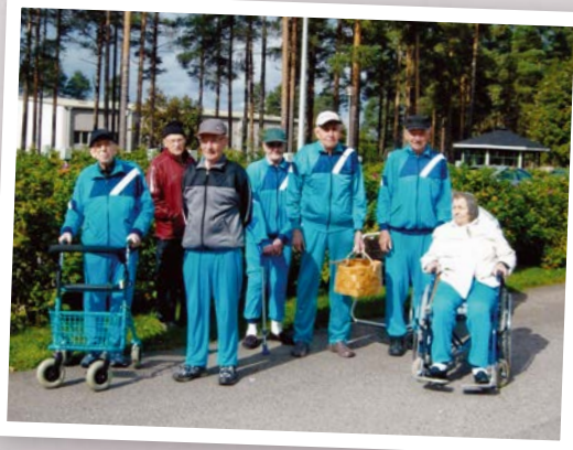
Käpyjenkeruureissulla vuonna 2010.