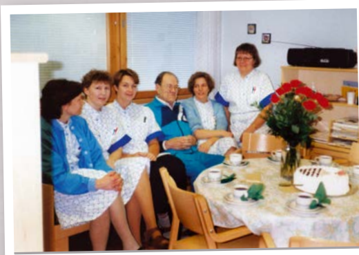
Hoitohenkilökunnalla tauon paikka.