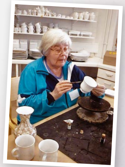
Posliinimaalaus on suosittua tekemistä.