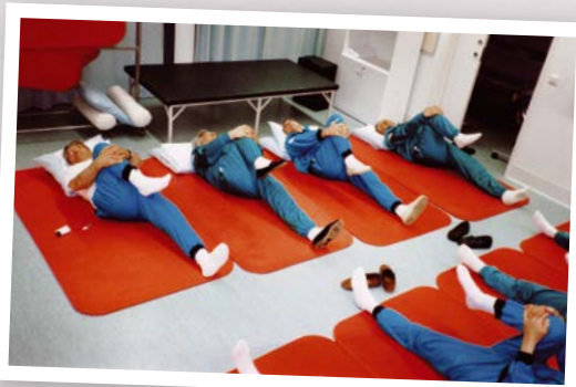
Yhdessä tekeminen tuo iloa päivään.