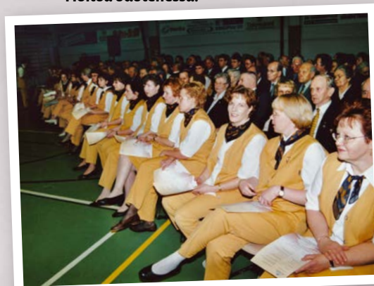
Henkilökuntaa Kitinkannuksen 10-vuotisjuhlassa.