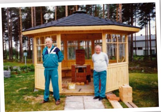
Pian grillataan säältä suojassa.