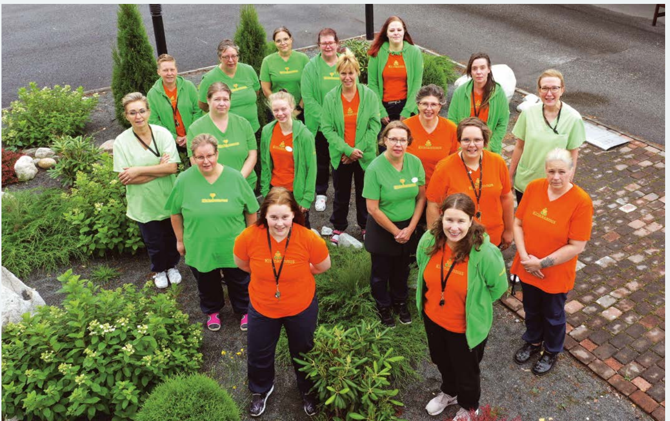
Kitinkodin henkilökuntaa kesällä 2021.