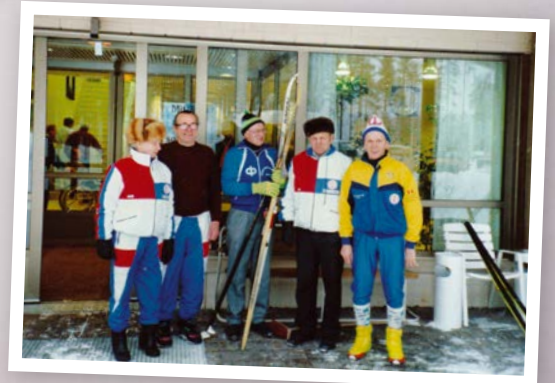
Hiihtoväkeä talvella 1993.