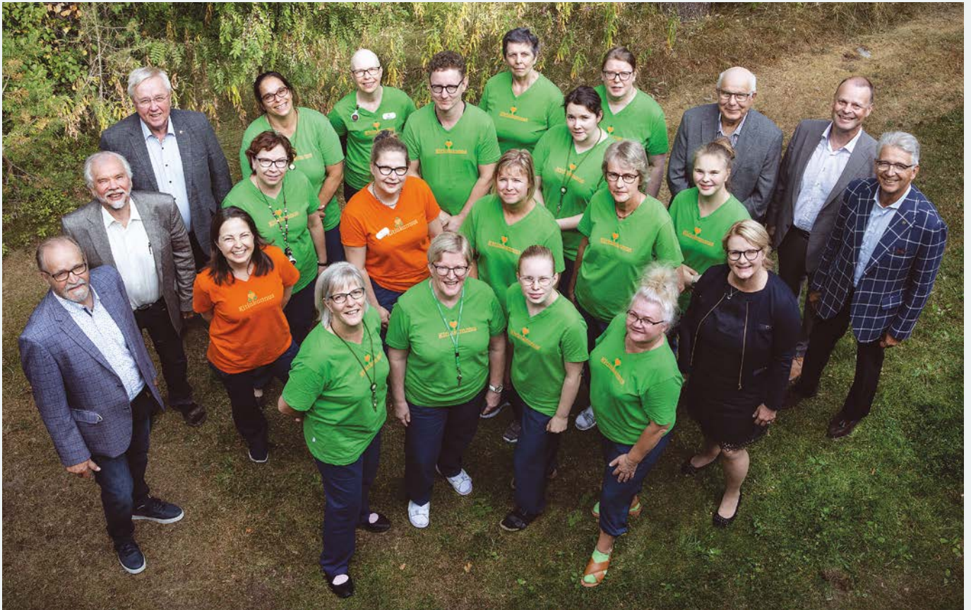
Kitinkannus-yksikön henkilökuntaa sekä Kitinkannus ry:n hallitus.