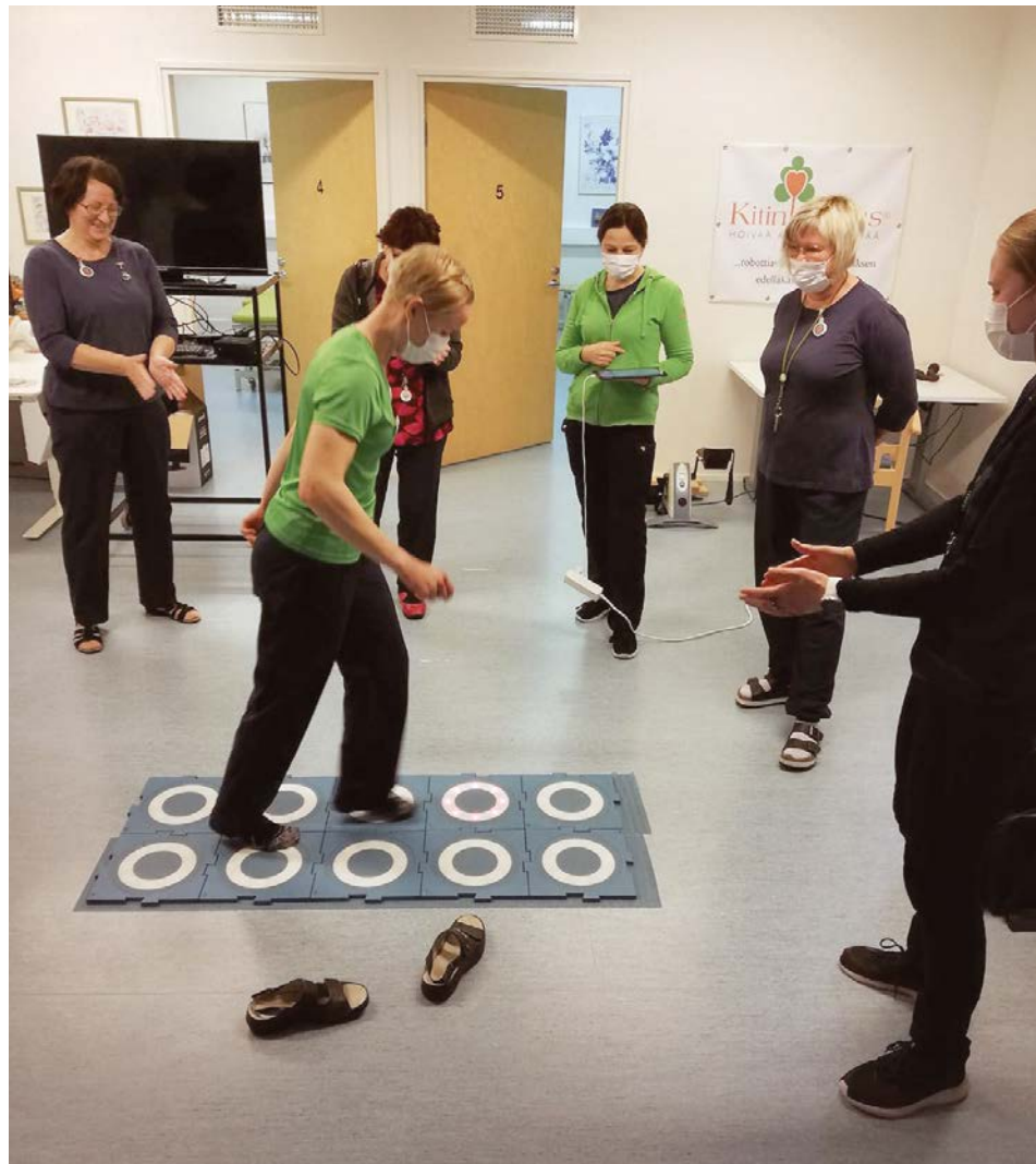
Liikuntalaatat auttavat kehittämään motoriikkaa ja liikkuvuutta.

- On tosi tärkeää, että kuntoutuksen ja hoivat ammattilaiset pääsevät testaamaan teknologioita ja antamaan palautetta niiden jatkokehittämiseen.