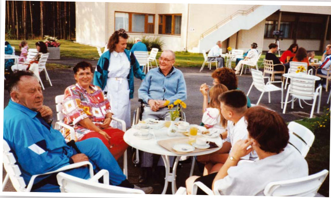
Puutarhajuhat kesällä 1993.