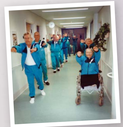
Venyttelyllä parempaa liikkuvuutta.