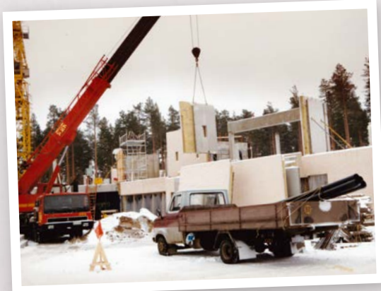
Kitinkannusta rakennetaan 1989.